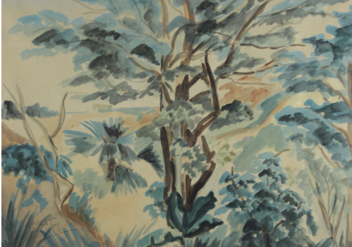
Tableau - "Vue du jardin"