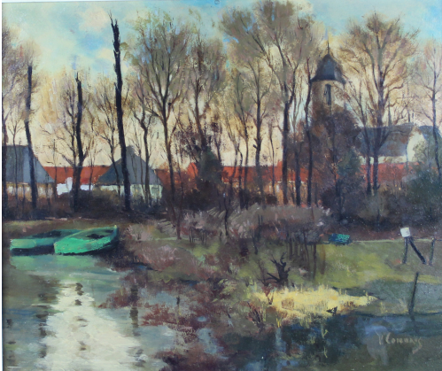
Tableau - "Vue de Lierre"