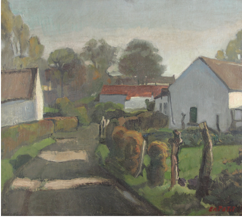
Tableau - "Le chemin du village"