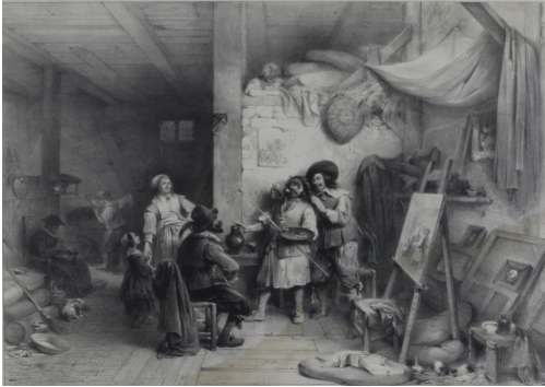
Tableau - "AD. Brouwer chez son Œuvre J. Van Craasbeek"