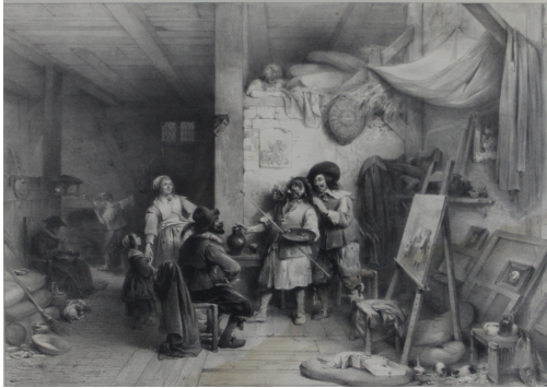
Tableau - "AD. Brouwer chez son Œuvre J. Van Craasbeek"