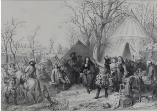
Tableau - "A.Vandermeulen au siège de Valenciennes"