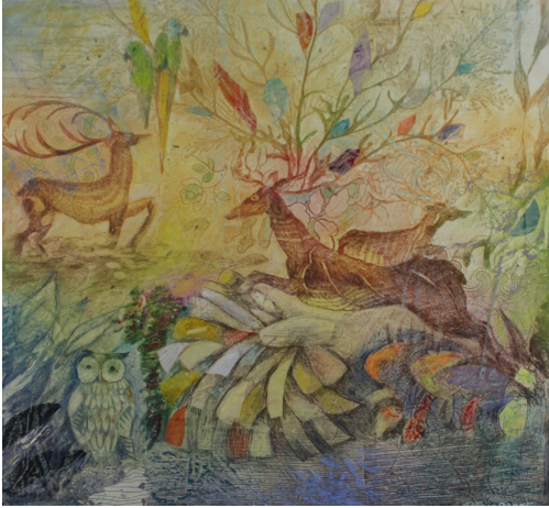
Tableau - "Maternité© sauvage"