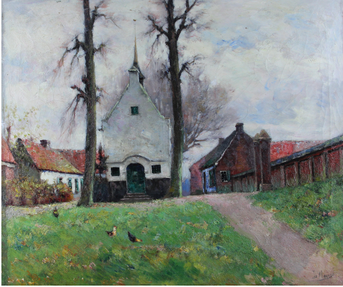
Tableau - "La chapelle"