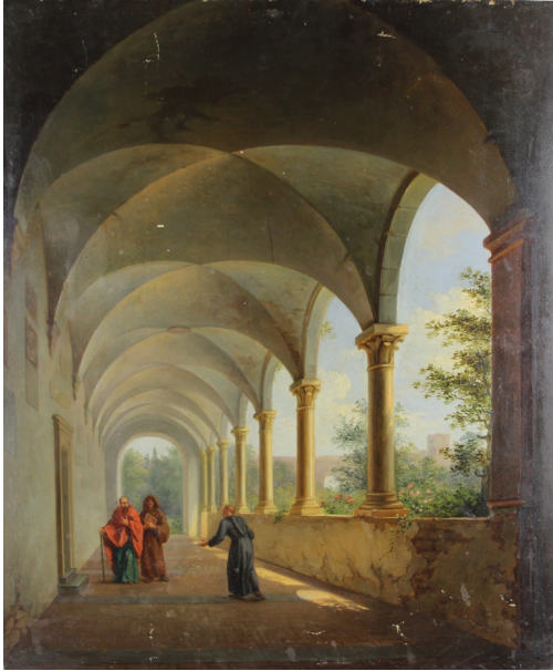
Tableau - "Le monastère"