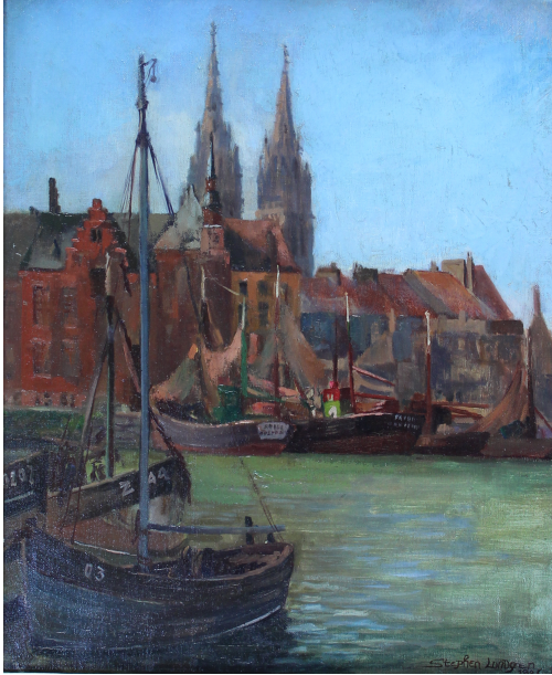
Tableau - "Ostende"