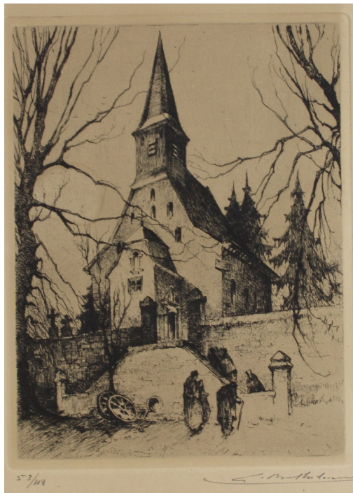
Tableau - "L'Église Gerouville"