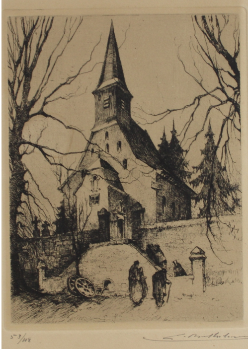
Tableau - "L'Église Gerouville"