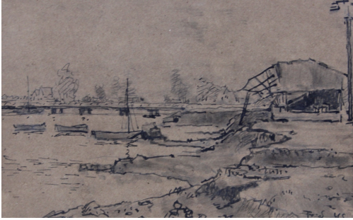
Tableau - "Nieuport bain"