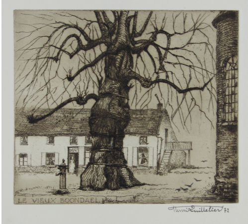
Tableau - "Le vieux Boondael"