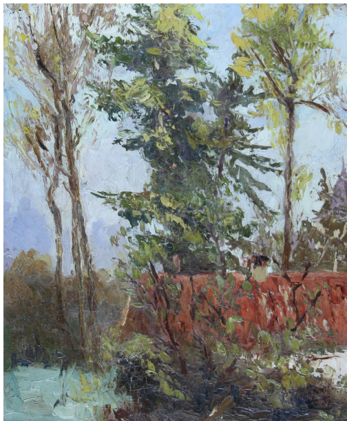
Tableau - "La chaumière"