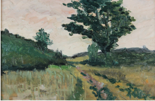
Tableau - "Paysage campinois (Genck)"