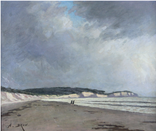
Tableau - "CÃ´te Bretonne"