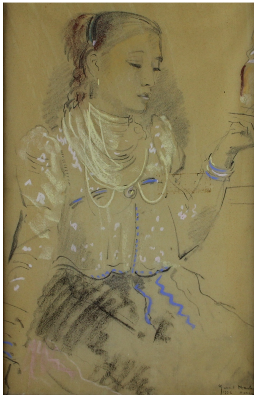
Tableau - "Hongroise "