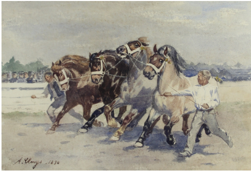
Tableau - "La présentation "