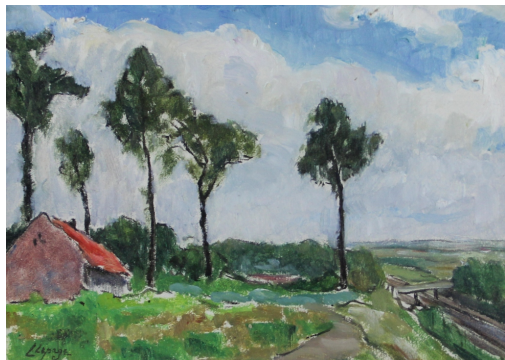
Tableau - "La ferme"