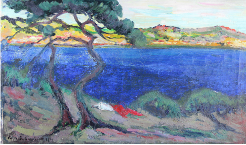
Tableau - "Paysage de provence"