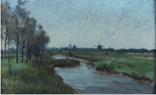
Tableau - "Paysage au moulin"