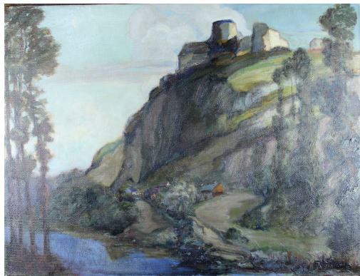
Tableau - "Château Gaillard Petit Andelys"