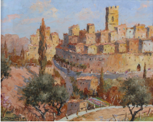
Tableau - "Village provençal"