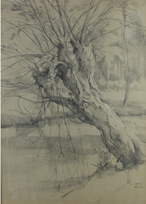
Tableau - "Le vieux saule"