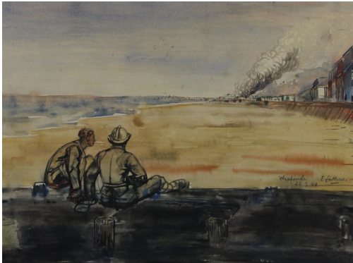
Tableau - "Feu À Westende"