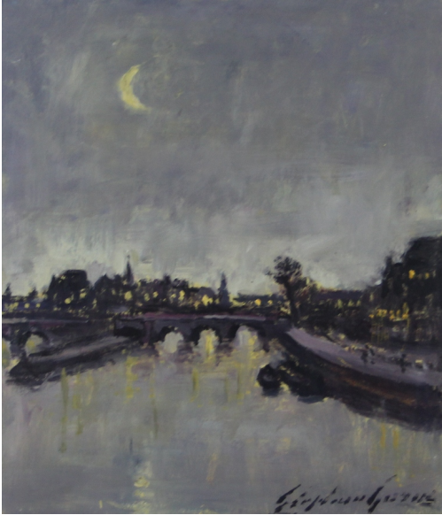
Tableau - "Quart de lune"