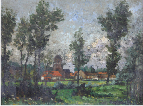
Tableau - "Le village"