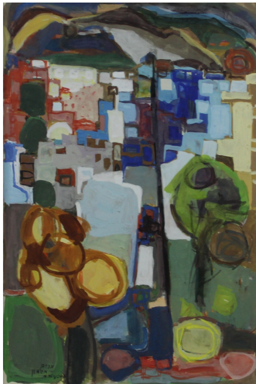
Tableau - "Le village sur la colline "