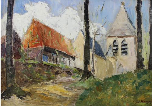
Tableau - "L'Église du village"