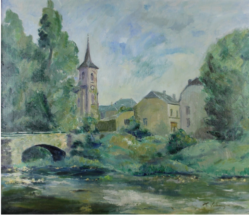
Tableau - "Le village"