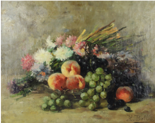
Tableau - "Nature morte aux fruits et aux fleurs"