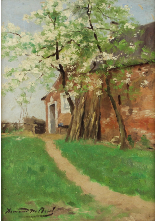
Tableau - "Printemps À Pede St Anne"