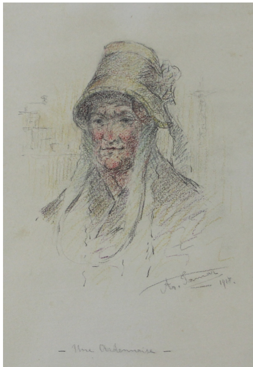
Tableau - "Une ardennaise"