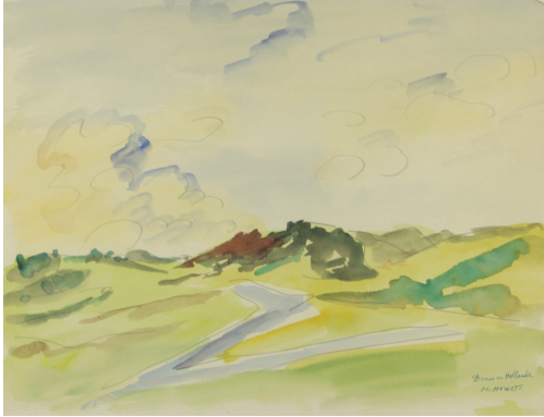
Tableau - "Dunes en Hollande"