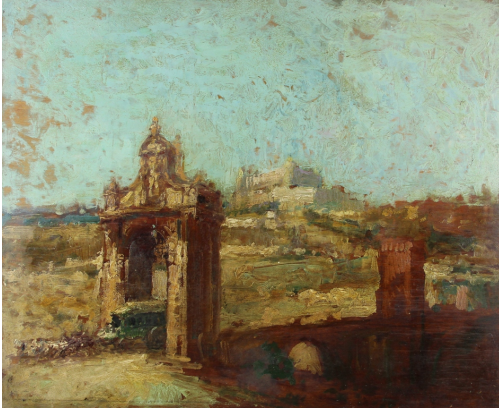
Tableau - "Ville antique du sud"