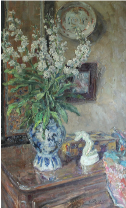
Tableau - "Mon intérieur"