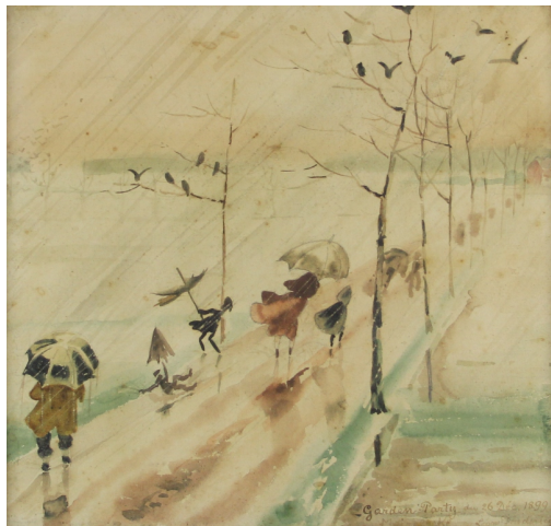
Tableau - "Garden Party Marelbeke"