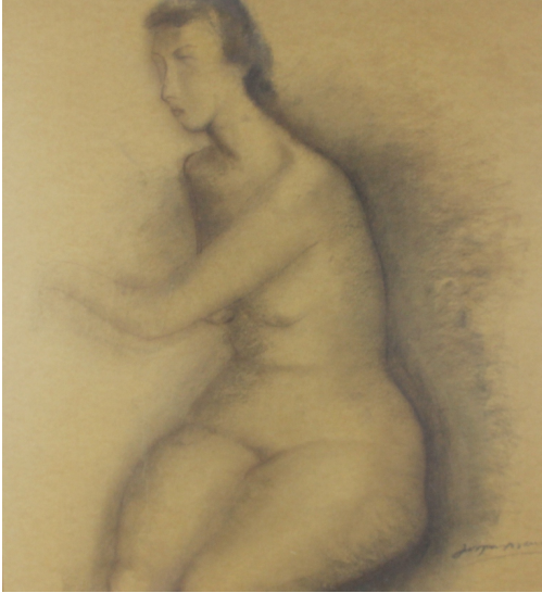
Tableau - "Femme nue"