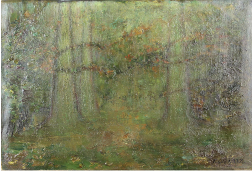
Tableau - "Le sous bois"