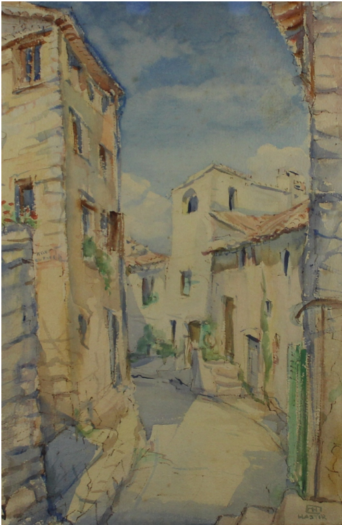
Tableau - "Tourette sur loup"