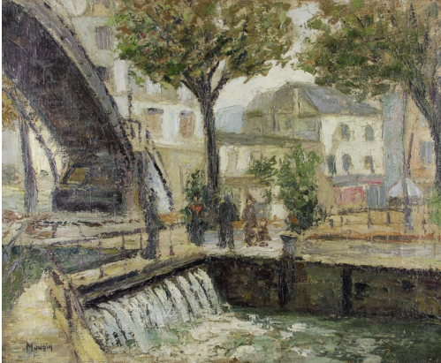
Tableau - "Quai de Jemappe Paris"