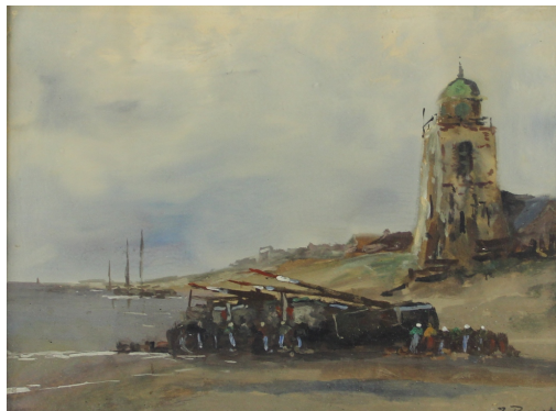
Tableau - "Le phare"