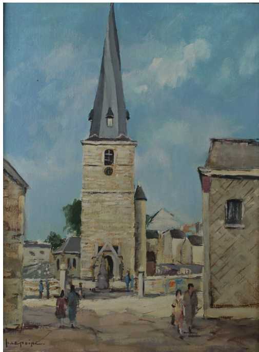
Tableau - "L'Église du village"