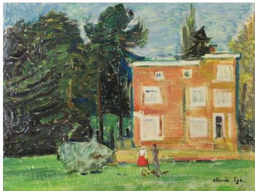
Tableau - "Mon jardin"