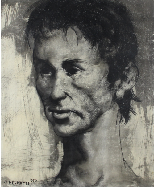
Tableau - "Portrait d'homme"