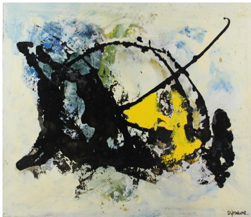
Tableau - "Insecte martien"