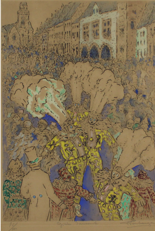
Tableau - "Gilles dansants "