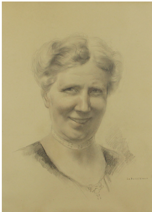
Tableau - "Portrait de femme"