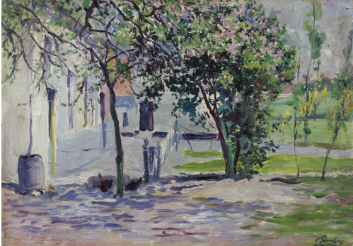
Tableau - "La petite ferme"