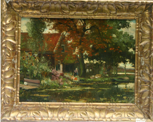
Tableau - "Au bord de l'eau"