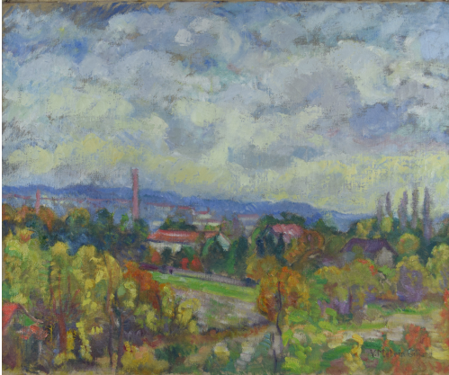
Tableau - "Vue sur le village"